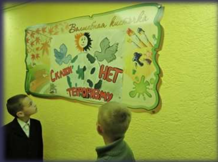
Оформление стенгазеты ко дню солидарности в борьбе против терроризма