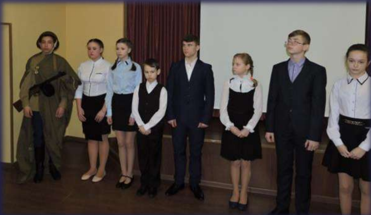
Мероприятие «Блокадный Ленинград»