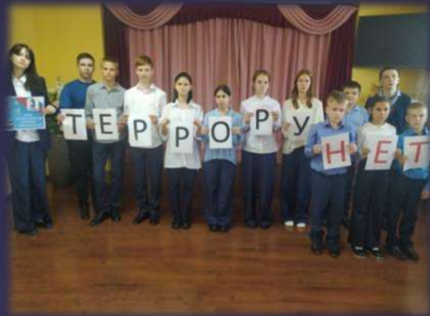
Проведение акции «День солидарности в борьбе против терроризма»