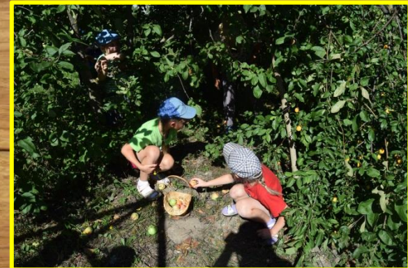
Сбор опавших яблок