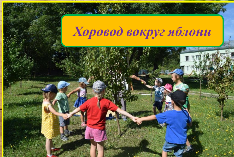
Хоровод вокруг яблони